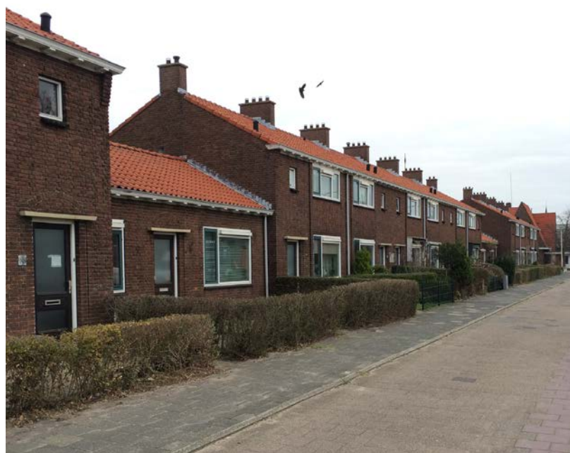
De 16 woningen aan de Rijnzichtweg

Vanaf 2011 zijn er voor de wijk Buitenlust in Oegstgeest fasegewijs plannen ontwikkeld en uitgevoerd voor sloop en nieuwbouw en grootschalige renovatie. Het gaat hierbij in totaal om 211 woningen, waarvan 61 nieuwbouwwoningen. Eind 2015 zijn deze nieuwbouwwoningen opgeleverd. De gemeente is gestart met de inrichting van de openbare ruimte rond deze woningen.