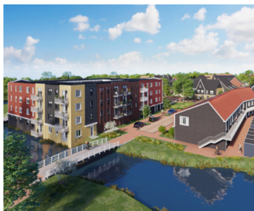
Artist impression project Westend

De bouw van 20 woningen aan de Kolk in Oud Ade is eind september gestart. In het wijkje schuin tegenover de kerk komen 20 huurwoningen in het sociale segment: 15 appartementen en 5 eengezinswoningen. Goed nieuws voor mensen die op zoek zijn naar een betaalbare en kwalitatief goede huurwoning in een kleinere kern van Kaag en Braassem. Met name voor woongroep Quackenbosch, die al jaren uitkijkt naar nieuwe, passende woningen in hun dorp. Naar verwachting worden de woningen in het voorjaar 2022 opgeleverd.