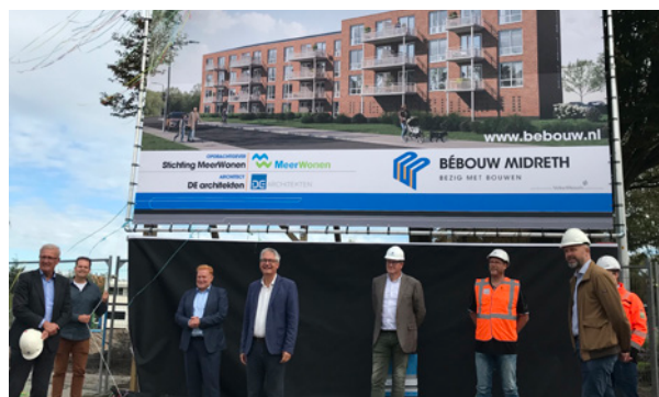
Officiële start project Gerardus

En inderdaad verloopt het tot nu toe goed! Op 2 december is het hoogste punt al bereikt en zoals het er nu naar uit ziet worden de sociale huurwoningen rond de zomer van 2021 opgeleverd. In januari gaan we hiervoor adverteren via de site: hureninhollandrijnland.nl . Door onder andere het aanbrengen van zonnepanelen op het dak worden de woningen zeer energiezuinig, een duurzame oplossing die bij appartementencomplexen nog weinig toegepast wordt.