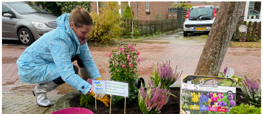
Mevrouw van Amsterdam uit Rijpwetering

Kijk voor meer informatie hierover op Onze site > Leefbaar > Ondersteuning activiteiten