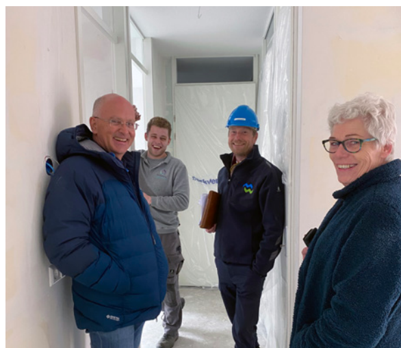
De oplevering van de woningen valt samen met de verspreiding van het bewonersblad. Daarom hier een foto van de kijkdag die eerder plaatsvond.

Eerder hebben de bewoners al een kijkje kunnen nemen in de nieuwe woningen en dat werd erg gewaardeerd. De appartementen zijn met lokaal maatwerk toegewezen. Hiermee krijgen inwoners van Kaag en Braassem voorrang. 31 van de 60 woningen zijn verhuurd aan huurders van MeerWonen via lokaal maatwerk. Twee woningen zijn aangeboden in een mantelzorgconstructie, waardoor mantelzorger en mantelzorgnemer dicht bij elkaar in het complex kunnen wonen. 10 van de huurwoningen die door verhuizing leegkomen, worden daarna weer aangeboden aan starters via lokaal maatwerk. Op deze manier blijven we de doorstroming in de gemeente versterken.