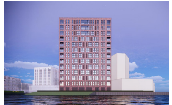
Artist impression Rhijnkade

De 72 sociale huurappartementen hebben een oppervlakte van ongeveer 50 vierkante meter. De overige 18 middeldure appartementen zijn iets ruimer met ongeveer 60 vierkante meter en een panoramisch uitzicht over de wijde omgeving. De bouwwerkzaamheden zullen naar verwachting begin 2024 van start gaan en de oplevering staat gepland in de loop van 2026. Het gebouw zal de naam 'Sublimes' dragen. Het is een originele combinatie van de woorden subliem en Limes. De naam verwijst daarmee duidelijk naar de historische omgeving. Wie interesse heeft moet ingeschreven staan bij Hureninhollandrijnland.nl .