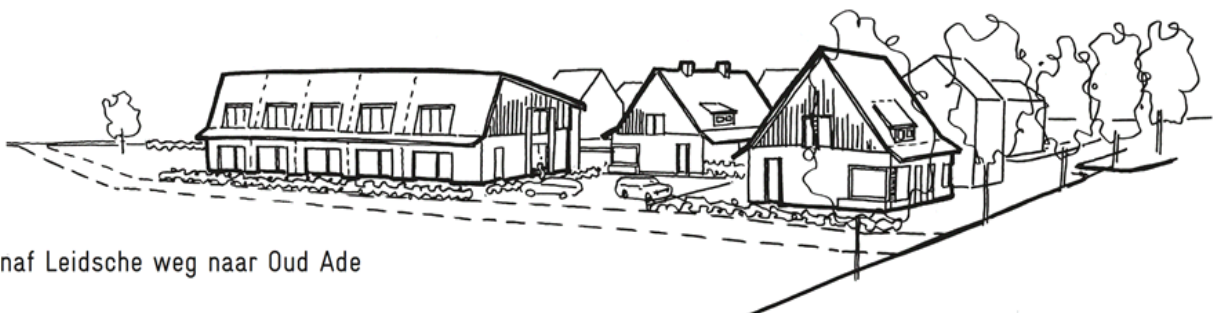
Zicht vanaf Leidsche weg naar Oud Ade

Belangstellenden die zich bij ons hebben gemeld, ontvangen een uitnodiging voor de bijeenkomst. Mocht u geen uitnodiging ontvangen maar wel geïnteresseerd zijn, stuur dan een e-mail naar redactie@stichtingmeerwonen.nl en u ontvangt deze alsnog.