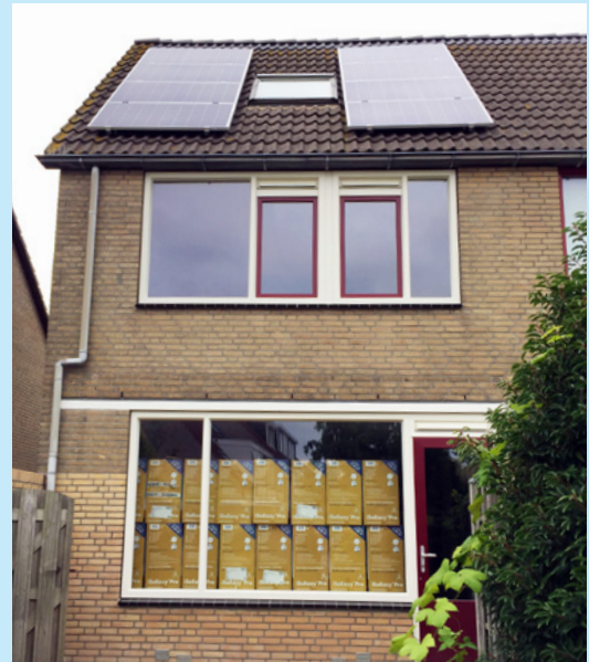
H.P. van der Poellaan

Na afloop evalueert MeerWonen het pilotproject en daarna gaan we deze maatregelen op grote schaal toepassen tijdens projectmatige onderhoudswerkzaamheden of als een woning leegstaat door verhuizing. Door deze maatregelen te koppelen aan geplande onderhoudswerkzaamheden kunnen we de woning op efficiënte wijze energiezuinig maken zonder de kosten hiervoor aan onze huurders door te berekenen. De enige bijdrage die aan de bewoners wordt gevraagd is een geringe bijdrage om de zonnepanelen en het bijbehorende dienstenpakket te kunnen gebruiken. Deze kosten zijn direct terug te verdienen door het gebruik van de zonnepanelen. Uiteindelijk zal het zonnepanelen pakket, dat door MeerWonen wordt aangeboden, ook op individuele basis aan te vragen zijn.